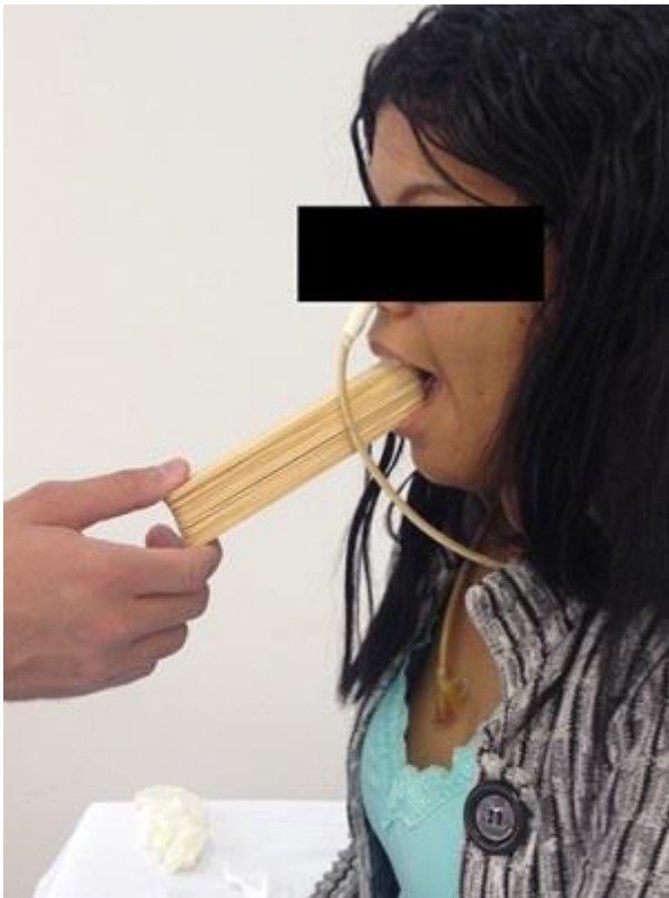
Figura 1 - Exercício de lateralização de mandíbula associado a mobilização.