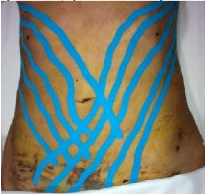
Figura 6 - Linfotaping em formato Fan em região de abdome.

Foi feita análise descritiva das variáveis e posteriormente foi aplicado o teste t para dados pareados para comparação entre as avaliações iniciais e finais. Para isso foi utilizado o software GraphPad Prism versão 5.