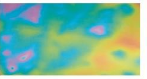
Figura 4 - Análise termográfica grau III da classificação da fibrose.