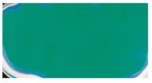
Figura 1 - Análise termográfica normal da classificação da fibrose.

Fonte: Manual do fabricante do Celluvision®