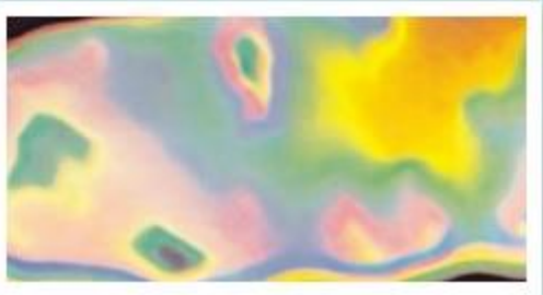
Figura 3 - Análise termográfica grau II da classificação da fibrose.