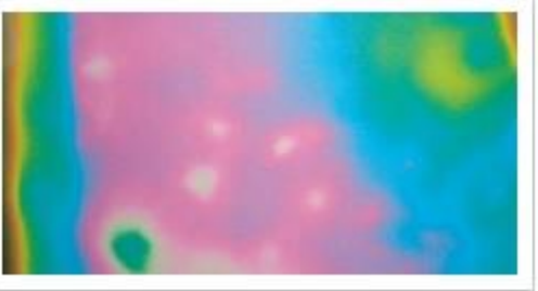
Figura 2 - Análise termográfica grau I da classificação da fibrose.