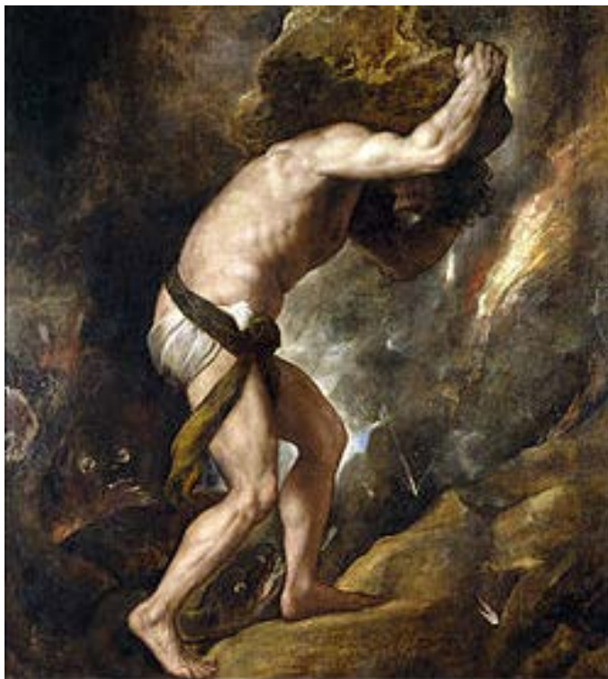
Figura 1. Sísifo, de Tiziano, 1549

Talvez na primeira leitura deste breve texto, os seus propósitos ainda não estejam claros. Usualmente, estudantes e profissionais planejam suas vidas (quando o fazem) baseados na remuneração financeira e derivativos, como se este fosse o desfecho final de uma carreira de esforços e sucesso. No entanto, apesar da sua importância social, a relação entre a remuneração e a satisfação não segue uma organização linear, sendo necessário refletir sobre quais escalas utilizaremos para avaliar nossas vidas e qual o valor do próximo patamar, afinal, utilizando as métricas erradas, o tempo e dedicação dispendidos podem não valer o prêmio.